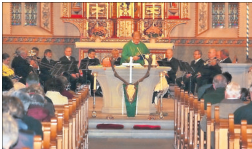
Die Bläser gaben der Messe ihr Gepräge.

JAGDHÖRNER Trotz des widrigen Wetters fanden sich viele Anhänger der Hubertusmesse in der Pfarrkirche in Merenschwand ein.