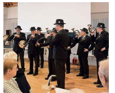
Die Zuger Spielhähne bei ihrem Auftritt.

UNTERÄGERI Der Seniorenhöck stand ganz im Zeichen der Tierfotografie. Dazu passte auch der Auftritt der Jagdhornbläser.