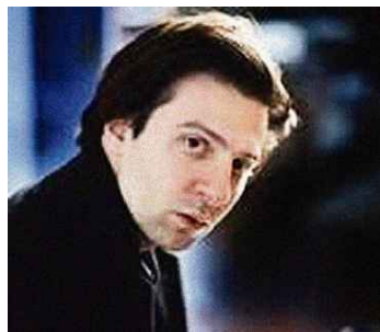
Der Pianist Vassilis Varvaresos.

ZUG Ein junger Pianist aus Griechenland begeisterte das Publikum – mit einer Verbindung aus Strenge, Anmut und Intuition.